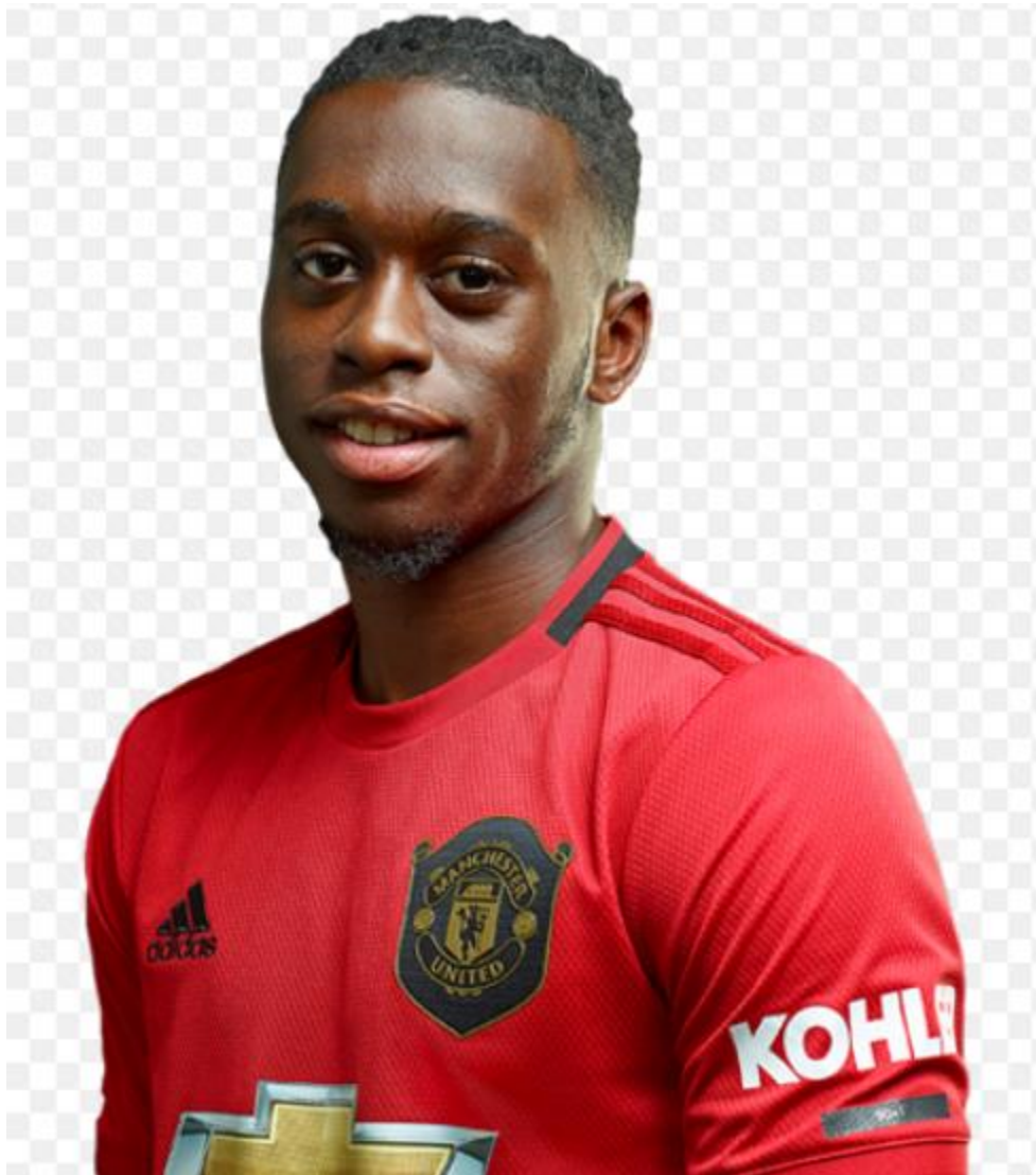
S: Aaron Wan-Bissaka (2P)